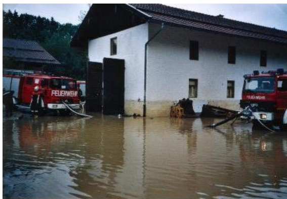
Hof von Anwesen Salzstraße 1