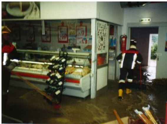
Aufräumarbeiten im GM-Markt