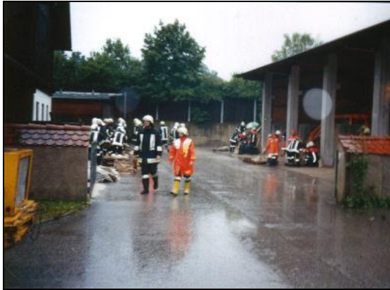
Sandsackfüllen im Bauhof

Hochwassereinsatz am 12.08.2002 in Siegsdorf / Wernleiten.